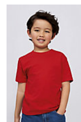
SOL'S Imperial KIDS 11770