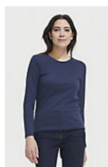
SOL'S Imperial LSL WOMEN