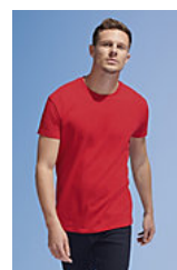
SOL'S Imperial 11500