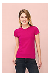
SOL'S MISS 11386