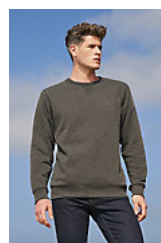
SOL'S SULLY 02990